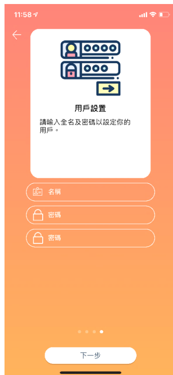
⑤ 輸入家長用戶名稱並設定密碼 (請輸入密碼兩次)，登記完成