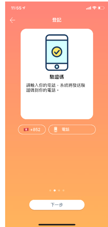
③ 輸入手提電話號碼以接收驗證碼短訊 (每個電話號碼只可登記一次)