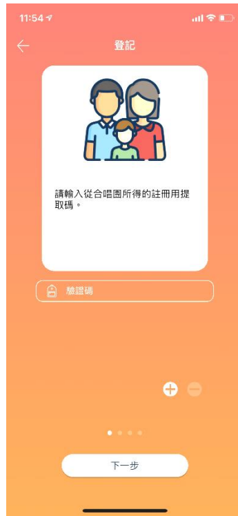
② 輸入由本團提供的「提取碼」 (如有多於一名子女在本團就讀，可按「+」一同輸入)