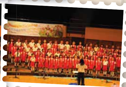
初一 C、初二 L