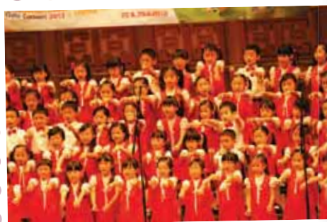
預備 H、預備 J、初一 H