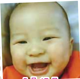
5月17日 優質潛能啟發課程導師 陳梓琪喜獲麟兒彭思佑