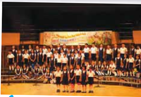
中一 I、中二 C