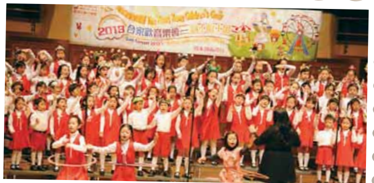
預備A、預備L、初一B、初二G