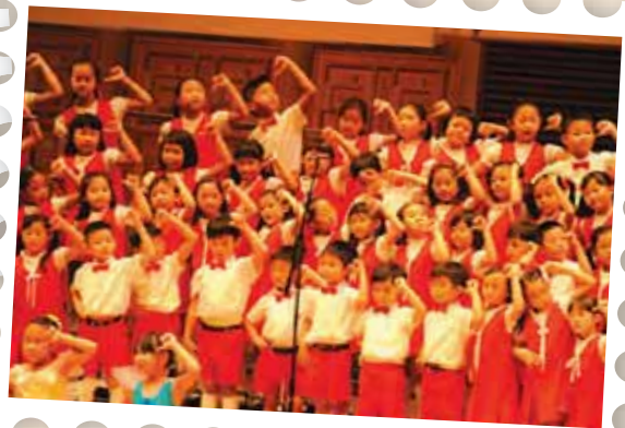
初一A、初一G、初二C、中一F