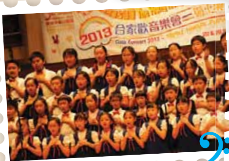
中一 D、中二 A、中二 G