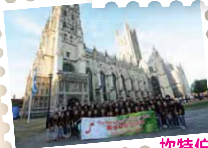
坎特伯雷大教堂導賞