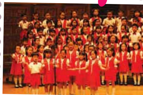
預備 F、預備 G、初一 F、初二 M