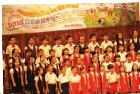
預備 O、中一 G