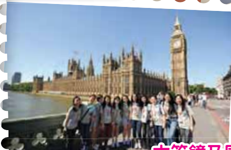
大笨鐘及國會大廈