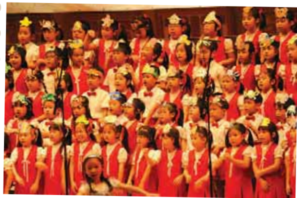
預備C、預備M、初一D、初一E