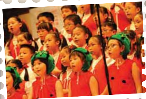
初二 A、初二 E、初二 I、初二 J