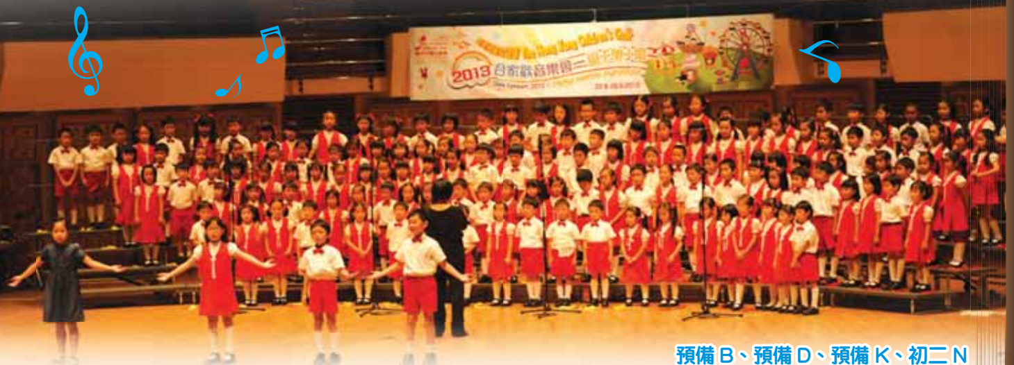
預備 B、預備 D、預備 K、初二 N