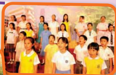
表揚狀頒發典禮 2013 Presentation Certificate Presentation Ceremony 2013 師生同行創未來