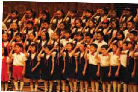
初二 B、初二 H、中一 J